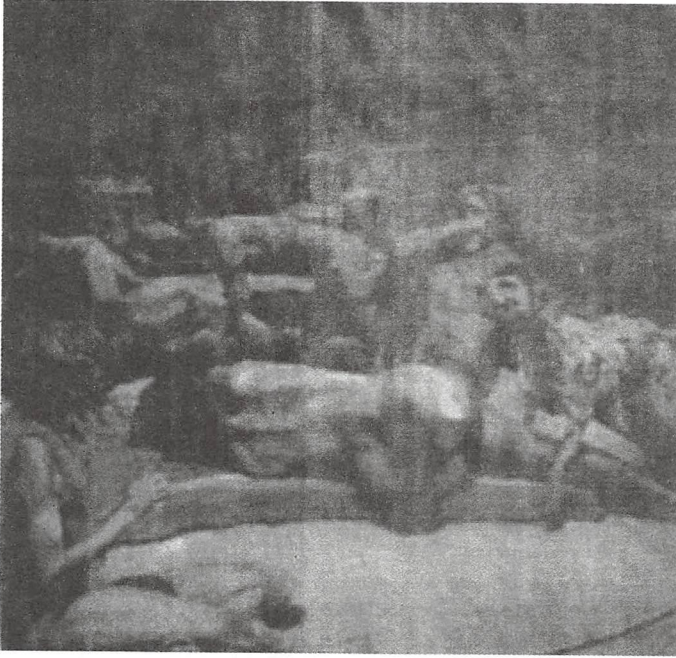
(لوحة إريك فيشل عن قارب العجوز وكلبه ، ١٩٨٢)

وتشير الصورة التى رسمها الفنان الأمريكى إريك فيشل Eric Fischl فى ١٩٨٢ عن "قارب الرجل العجوز وكلبه" الواردة أدناه، الكثير من الأسئلة. فهل تصور رحلة للمتعة أو أعقاب كارثة؟